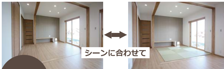
シーンに合わせて