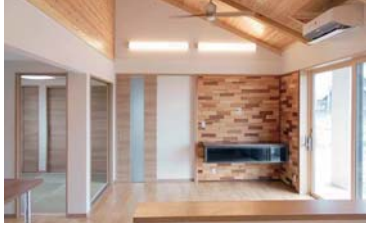
ZEHの家にして部屋の温度や光熱費をコントロールできるようにしました。

みんなが集うLDKは天竜杉を使った勾配天井とし、温かみと開放感のある空間にしました。リビングから繋がるウッドデッキもこだわりのひとつです。