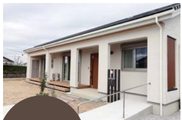
浜松市東区 Y様邸 平成30年9月 お引渡し

「生活の中心は1階で」という家族共通の考えがあったので、平屋建ての間取りで話は進みました。親からのアドバイスもあって、ゲストルームや収納量を増やしたい事を営業の方に相談したら「それは2階に持っていきましょう」という提案を頂きました。平屋から2階にという間取りに階段が増えるし、正直どうなるのかイメージが掴めずにいたんです。でも次の打合せで図面やパースを見たら外観は平屋、でも実は2階建てという上手い具合に納まっていました。高さを工夫すれば、こういう家が作れるんですね。